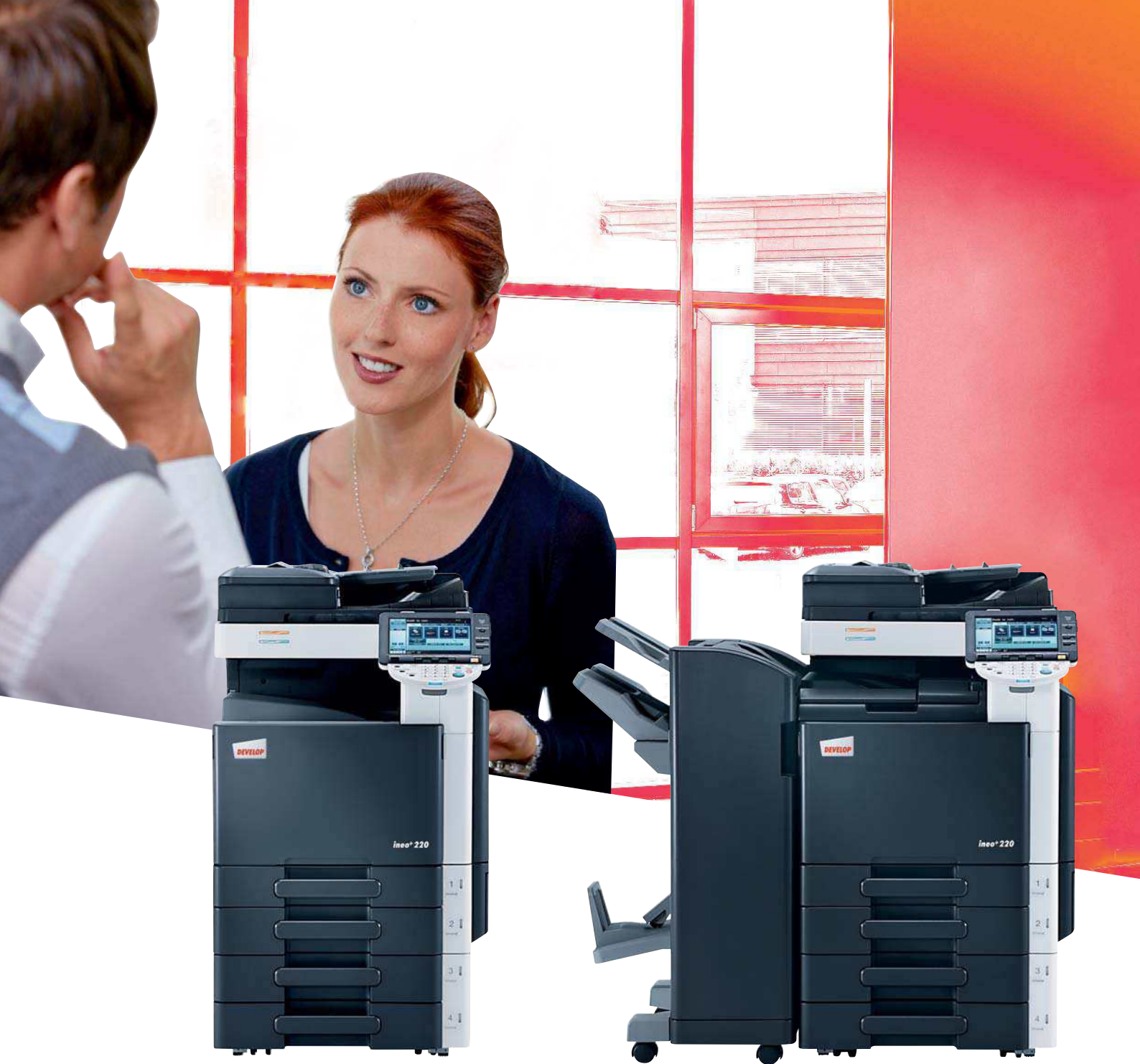
ineo + 220 mit Origineleinzug (DF-617) und 2x 500 Blatt Papierkassette (PC-207)